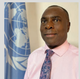
François Batalingaya Coordonnateur résident Système des Nations Unies en Union des Comores